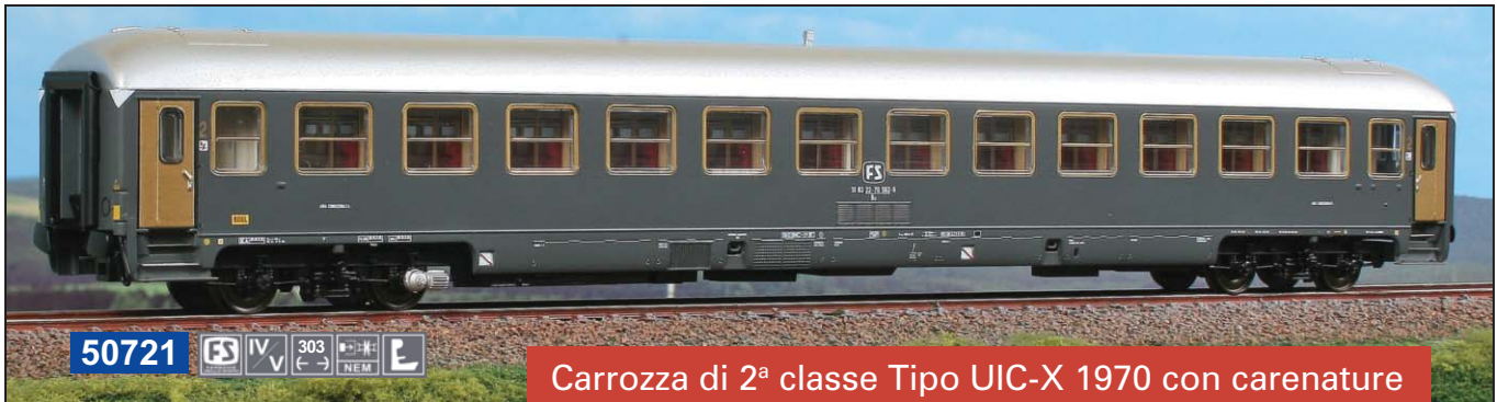
50721 FS IV V 303 (←→) NEM E

Carrozza di 2 a classe Tipo UIC-X 1970 con carenature originali grandi ed impianto condizionamento BBC. 2 nd class Type UIC-X 1970 of Italian Railways with original large skirt and airco BBC. 2er Klasse Typ UIC-X 1970 Wagen der FS mit breiter Schürze und BBC Klimaanlage .