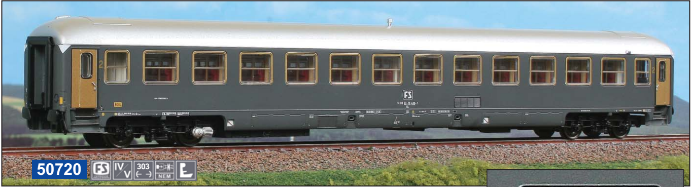
50720 FS IV V 303 (←→) NEM E

Carrozza di 2 a classe Tipo UIC-X 1970 con carenature originali grandi ed impianto condizionamento Friedmann-Luwa. 2 nd class Type UIC-X 1970 of Italian Railways with original large skirt and airco Friedmann-Luwa. 2er Klasse Typ UIC-X 1970 Wagen der FS mit breiter Schürze und Friedmann-Luwa Klimaanlage .