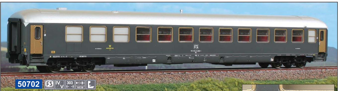
50702 FS IV V 303 (←→) NEM E

Carrozza Ristoro di 2 a classe Tipo UIC-X 1970 con carenature originali grandi, in livrea grigio ardesia. Snack Bar 2 nd class Type UIC-X 1970 of Italian Railways in slate gray livery and original large skirt 2er Klasse mit büfett Abteil Typ UIC-X 1970 Wagen der Italienischen Eisenbahnen in schiefergrauer Lackierung mit breiter